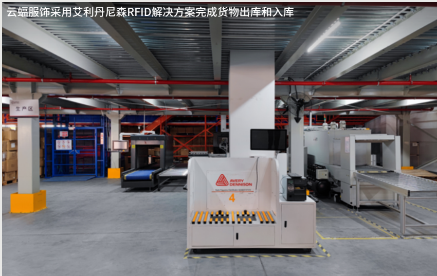
云蝠服饰采用艾利丹尼森RFID解决方案完成货物出库和入库

云蝠服饰将与艾利丹尼森继续深化供应链的数字化转型，将RFID解决方案从工厂端、仓库端继续扩展至每一家零售门店。RFID技术提供的数字身份验证和溯源将助力零售门店提升收货和盘点效率，有效实现产品防盗、防伪，从而更好地保护品牌声誉。未来，消费者还能通过RFID吊牌获得更加个性化和交互式的购物体验，只需扫描服装上的二维码，即可获得详细的产品信息，这将进一步增加消费者对品牌的信赖与忠诚。